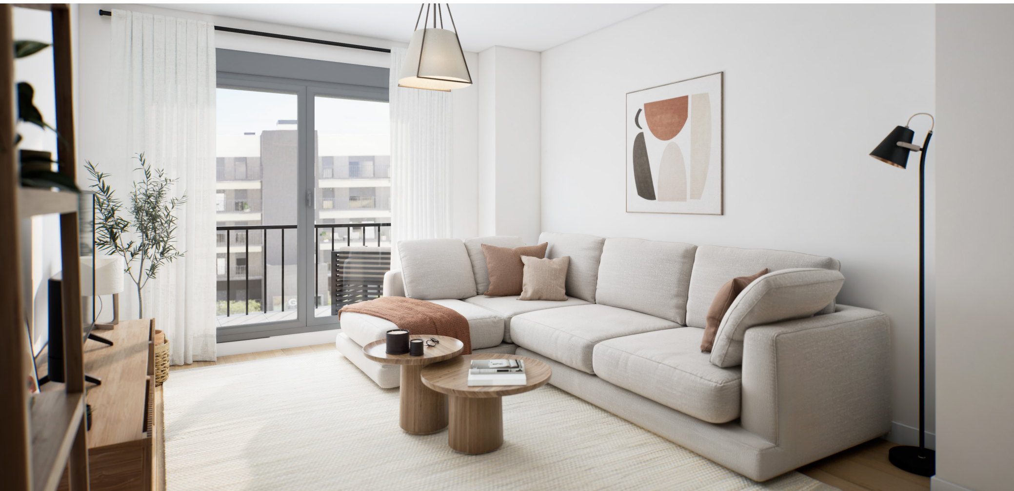
Interior de la vivienda. Acabados