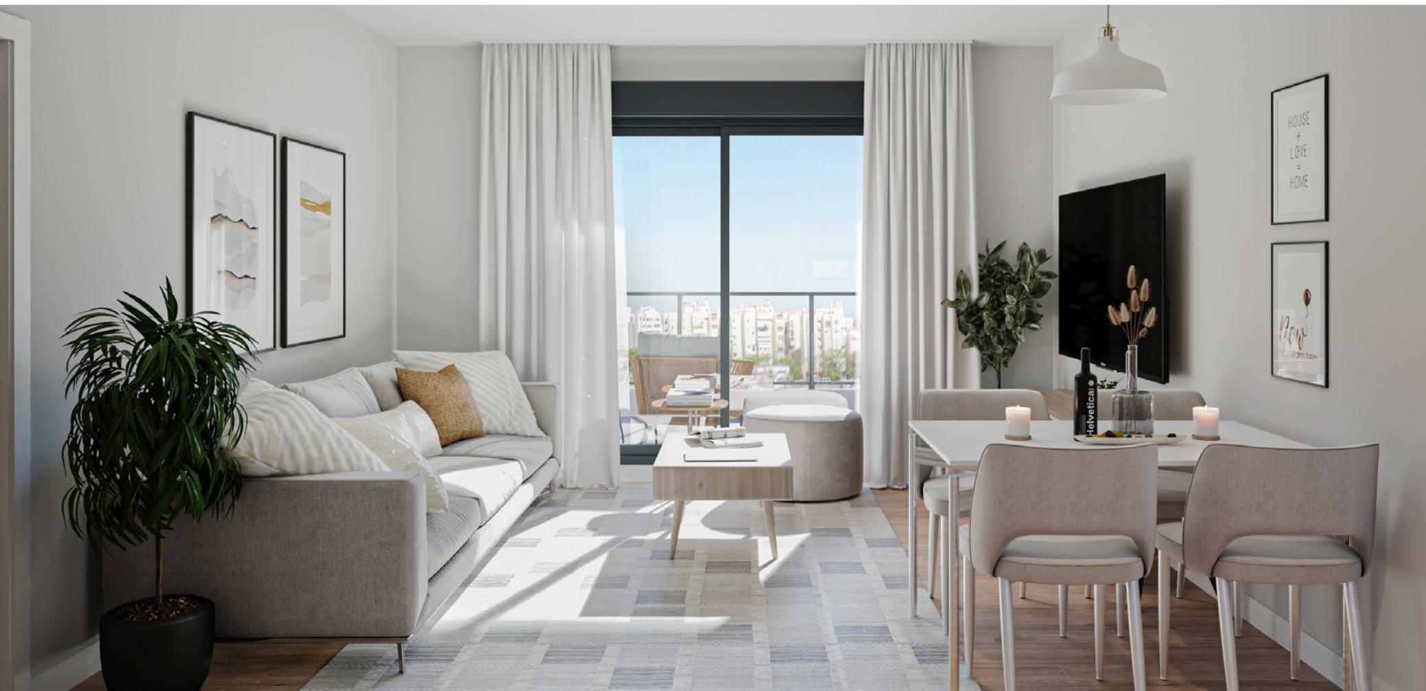
Interior de la vivienda. Acabados